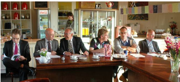
Het bestuur bereidt zich voor op de vergadering.

Redactie en vormgeving: DBB Projectmanagement & PR – Joke de Boer